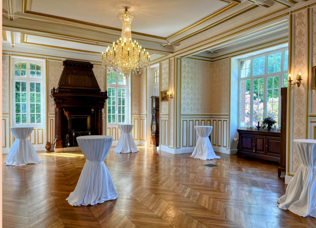
Le salon du château