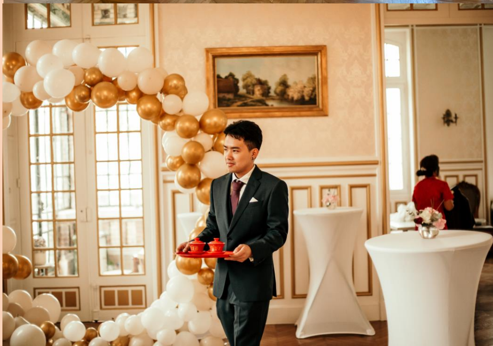
Capacité maximale: 100 personnes