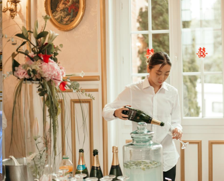
Un cadre parfait pour votre cocktail